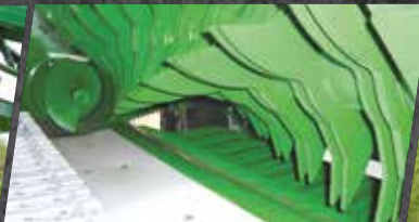
15 Messer Schneidwerk