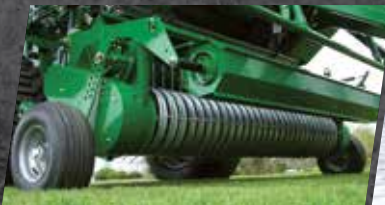
2m HL Pick Up 5-reihig

Jetzt mit 1/3 Finanzierung zu 0,99% Fixzinssatz! *inkl. Mwst.