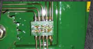
Zentral verrohrte Schmier- leisten